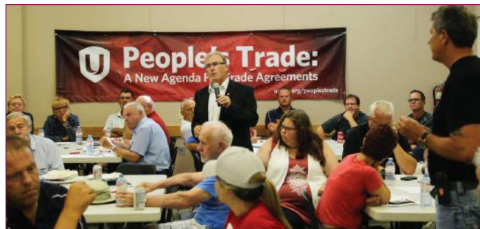
Unifor a soumis ses recommandations sur l'ALENA au gouvernement fédéral avant le début des pourparlers

veilleront à ce que l'ALENA et tous les futurs accords commerciaux soient abordés différemment, soutient M. Dias. Il est grand temps que le commerce aide les travailleurs et la population au lieu de leur nuire. »