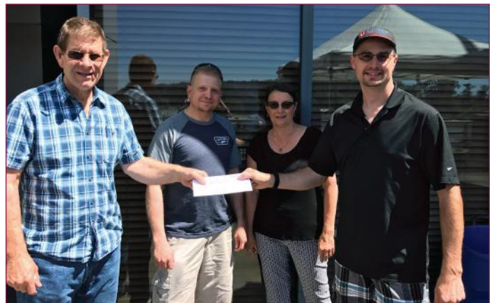
Un barbecue pour collecter des fonds a été organisé au bureau régional de l'Ouest d'Unifor afin d'aider les victimes et les évacués des feux en C.-B.

DANS CE NUMÉRO Unifor se prononce sur l'ALENA alors que les négociations s'apprêtent à commencer. La lutte s'intensifie pour sauver les sociétés de la Couronne de la Saskatchewan contre la privatisation. Des membres viennent en aide aux victimes des feux en C.-B. Le Conseil canadien se promet d'être instructif et inspirant. L'infolettre Uniforum devient une revue nationale, et plus