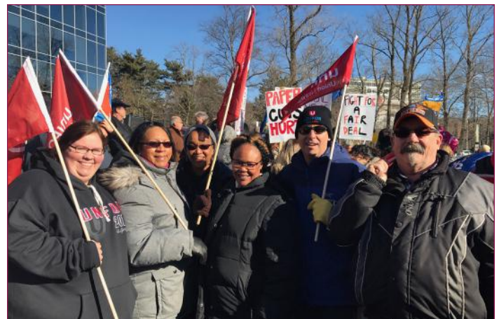
Les employés de la salle de rédaction du journal The Chronicle Herald sont en grève depuis le 23 janvier 2016.