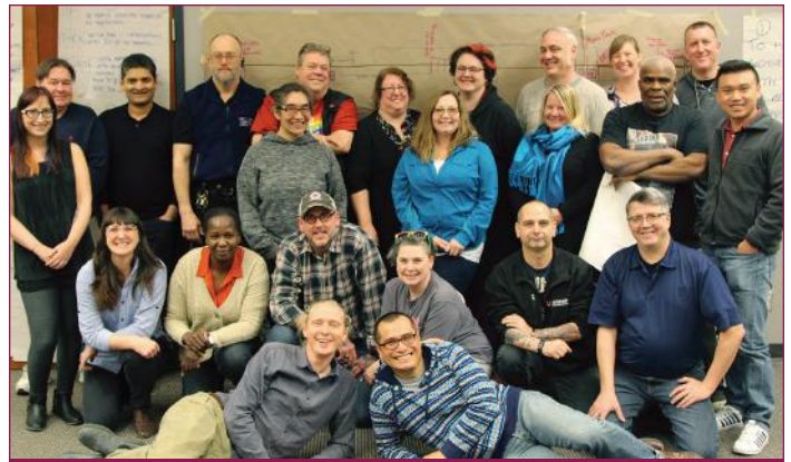
Des militants des sections locales en C.-B. sont prêts à défaire le gouvernement de Christy Clark.

Pour vous impliquer et en apprendre davantage, cliquez sur www.unifor.org/commerceequitable