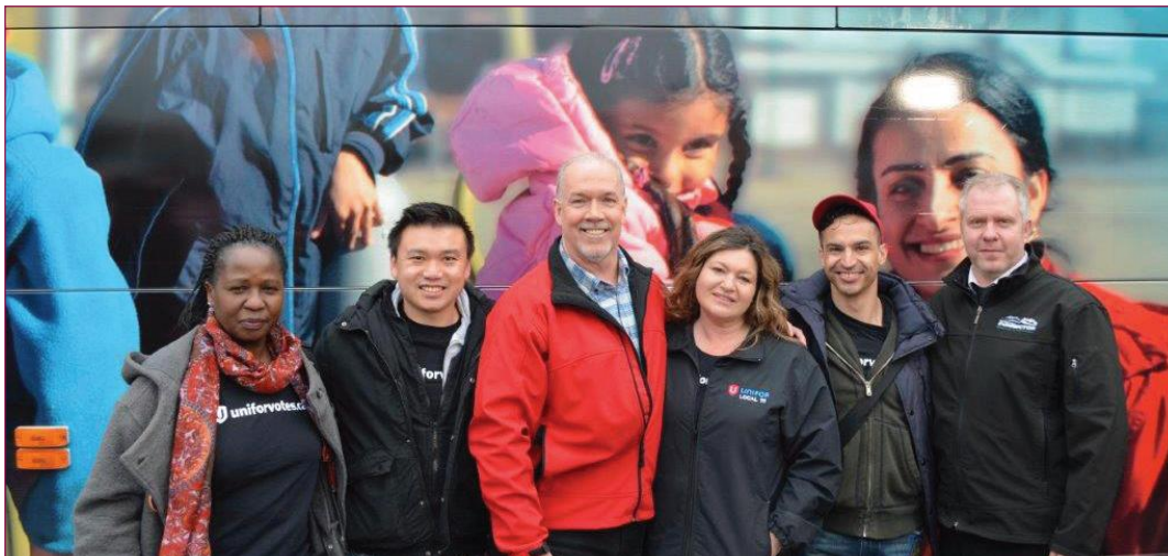
Le chef du NPD en C.-B., John Horgan, lance sa campagne électorale avec des membres d'Unifor à ses côtés.