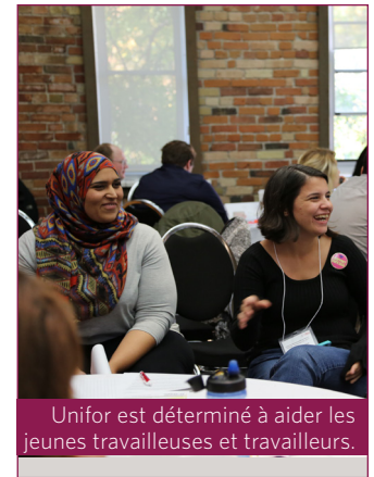
Unifor est déterminé à aider les jeunes travailleuses et travailleurs.

« Les cadres des banques se portent très bien, l'industrie automobile et ses cadres se portent aussi extrêmement