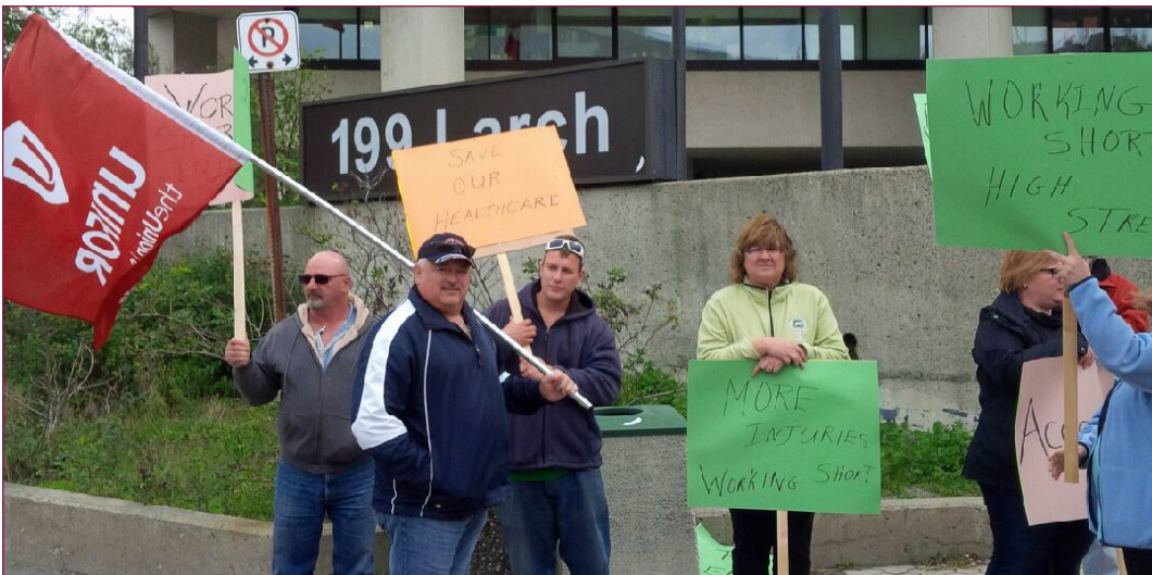
Des membres d'Unifor ont manifesté récemment à Sudbury à l'extérieur d'un établissement provincial de soins de longue durée pour soutenir les pourparlers en cours entourant les soins de santé et exprimer leur appui au régime universel de soins de santé au Canada.