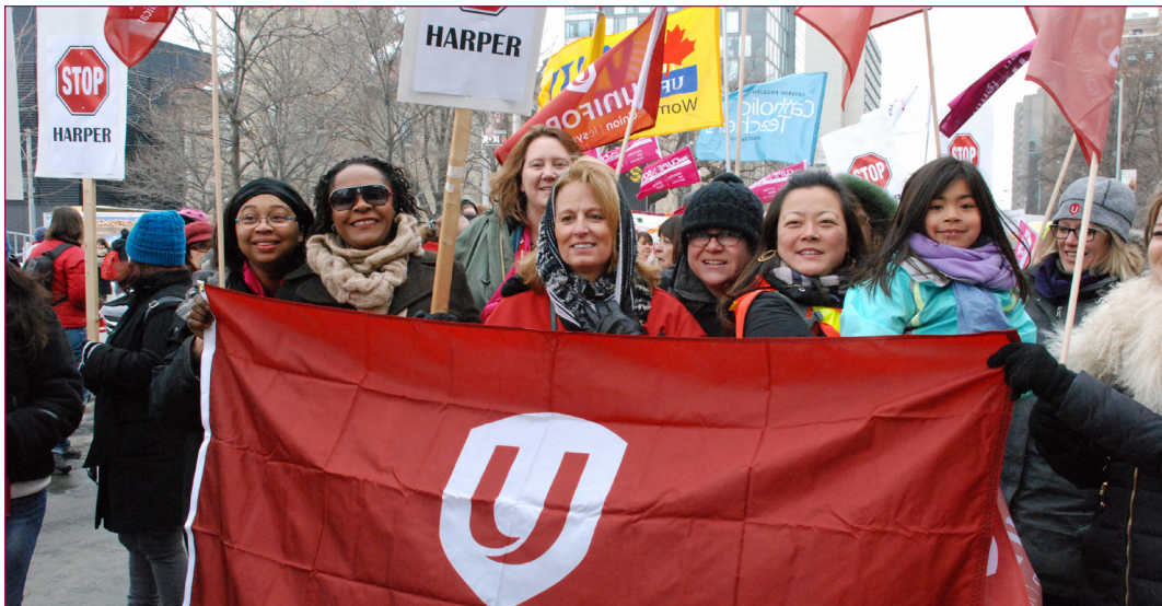
Des membres d'Unifor participent à des rassemblements et d'autres événements au Canada pour souligner la Journée internationale de la femme.