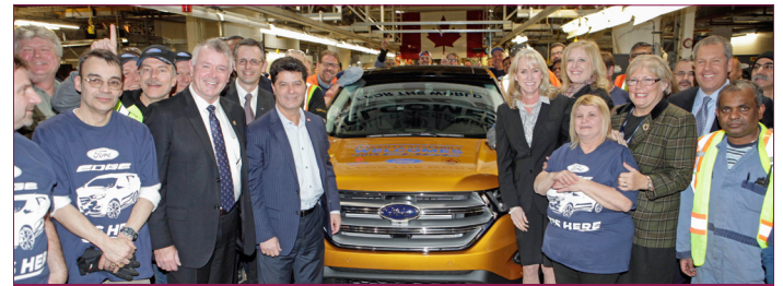
Le président national d'Unifor, Jerry Dias, était présent avec les membres de la section locale 707 pour le lancement de la nouvelle Ford Edge.

La nouvelle génération des multiségments comme la Ford Edge a suscité la création d'emplois à l'usine qui sont passés de 1 400 à 4 500, ce que Jerry Dias considère être une bonne nouvelle pour les jeunes de la région et qui démontre à tous les jeunes au pays que des emplois de qualité peuvent être créés avec