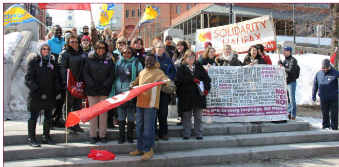
Des membres d'Unifor manifestaient à l'occasion de la Journée internationale de la femme à Halifax

Unifor et le reste de la délégation canadienne se sont