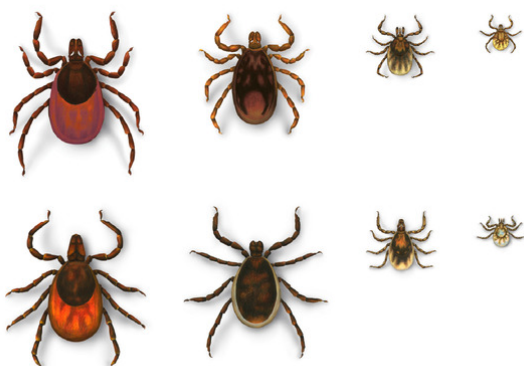
Tique à pattes noires