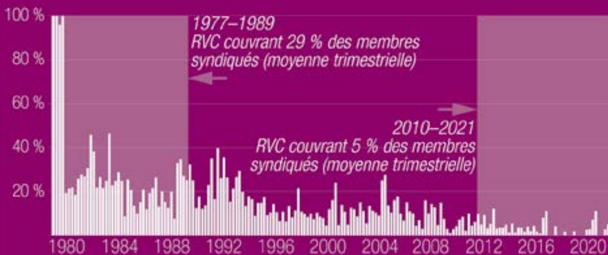
Figure 4 : Proportion d'ententes salariales majeures* au Canada offrant un rajustement de vie chère (RVC), Canada, données trimestrielles (Source : Statistique Canada 14-10-0348-01, EDSC)

atténuée par les plafonds salariaux du secteur public dans divers territoires). L'inflation a absorbé 82 % de cette augmentation (ou 2,80 $ l'heure), les travailleuses et travailleurs gagnant en moyenne seulement 0,60 $ de plus par rapport à la période prépandémique.