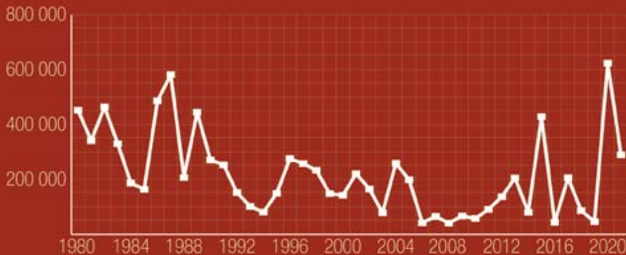
Figure 1 : Membres syndiqués touchés par des arrêts de travail, Canada, 1980-2021

Aux États-Unis, où les taux de syndicalisation sont parmi les plus bas au monde, la faveur du public à l'égard des syndicats a atteint des sommets jamais vus depuis 1965. Au Canada et ailleurs, un nouveau souffle de militantisme chez les travailleurs face aux problèmes persistants de sécurité au travail, aux salaires continuellement bas et à l'inflation élevée en incite d'autres à exiger mieux de leurs employeurs et à faire le piquet de grève si nécessaire. En 2020, un nombre encore plus élevé de travailleuses et travailleurs au Canada étaient touchés par des conflits de travail (grèves et lock-out) qu'à n'importe quel moment depuis 1976.